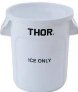
CONTENEDORES PARA HIELO