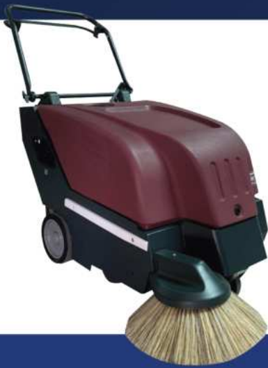
BARREDORA DE PISO KLEEN SWEEP 28