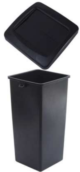
ZAFACON MANOS LIBRES 87 LTS