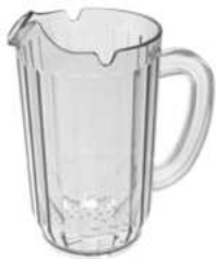
JARRA DE PLÁSTICO