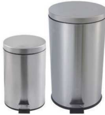
ZAFACON DE PEDAL EN ACERO