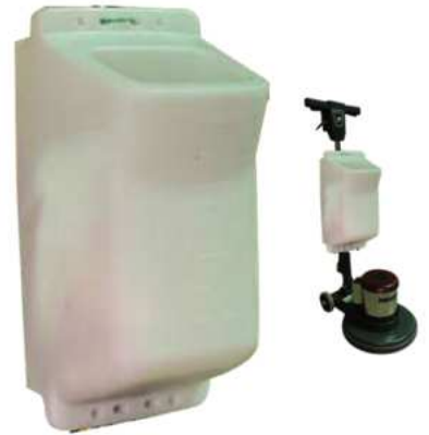
TANQUE DE SOLUCIONES