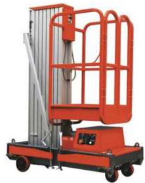
PLATAFORMA DE TRABAJO MÓVIL.