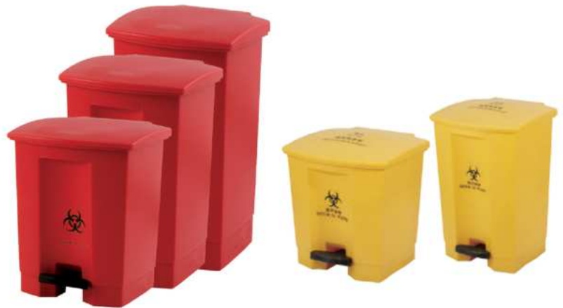
ZAFACON DE DESECHOS BIOLÓGICOS DE PEDAL 15/ 30/ 50 LTS