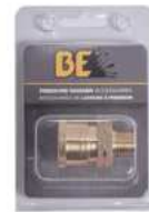
ACOPLADOR, 3/8" QC MNPT PKG