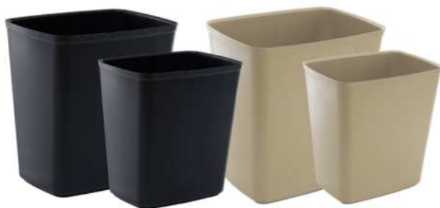
ZAFACONES RESISTENTE AL FUEGO