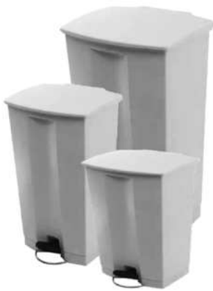
ZAFACON DE PEDAL 15/ 30/ 50 LTS