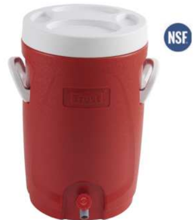
NEVERAS PARA BEBIDAS FRÍAS