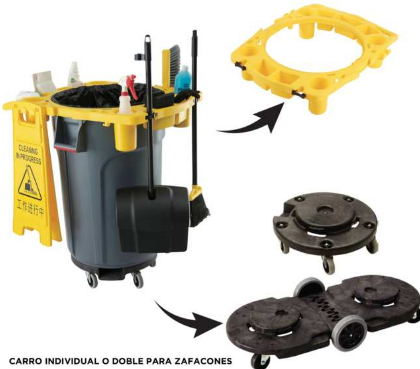
CARRO INDIVIDUAL O DOBLE PARA ZAFACONES