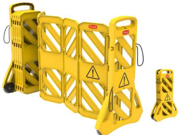
CERCA DE SEGURIDAD