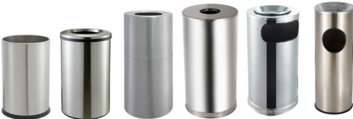
ZAFACONES DE MANO LIBRES EN ACERO INOXIDABLE