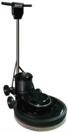
PULIDORA DE PISO MR 2000