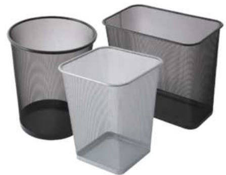
ZAFACON DE MALLA EN ACERO PARA OFICINA