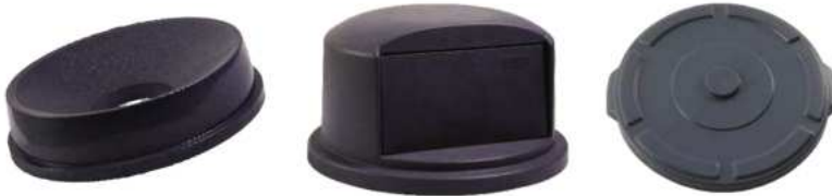
TAPA DE ZAFACON PARA TODO USO