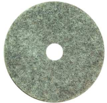
DISCO DE PULIR PUNTA DIAMANTE