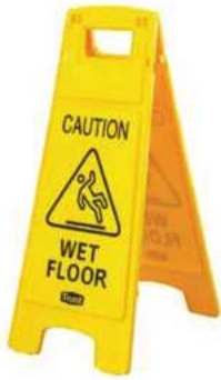
AVISO DE PRECAUCIÓN PISO MOJADO PLEGABLE