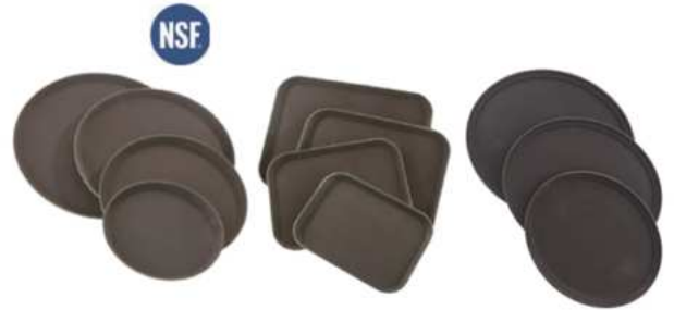
BANDEJAS ANTIDESLIZANTES DE PRFV