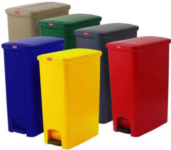
ZAFACON DE PEDAL 18 GAL