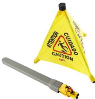
CONO DE SEGURIDAD PLEGABLE