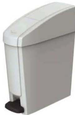
ZAFACÓN SANITARIO 3 GALONES

- La solución sanitaria y segura para manipular Disposiciones.