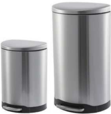
ZAFACON DE ACERO INOXIDABLE OVALADO DE PEDAL