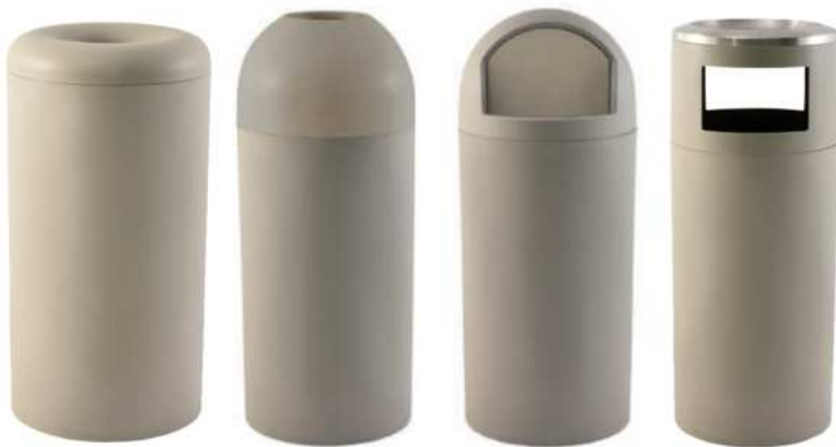
ZAFACONES DE BASURA MANOS LIBRE