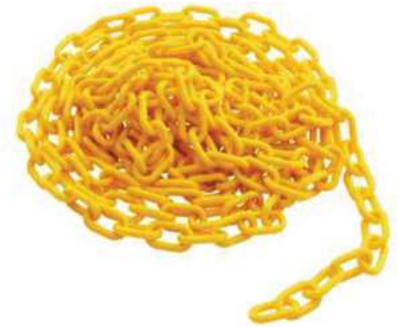
CADENA DE BARRICADA PARA CONOS DE SEGURIDAD