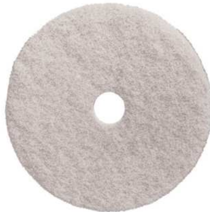
DISCO DE PULIR SINTÉTICO