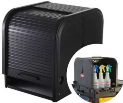
CAJÓN CON CERRADURA