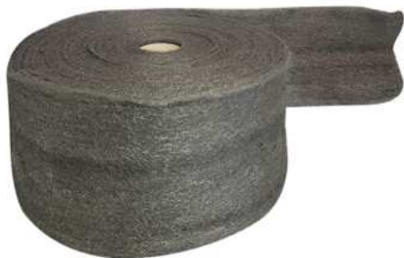
PAD LANA DE ACERO 2170 ROLLO 5045-4