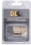
ACOPLADOR 3/8 Q / C FNPT PKG