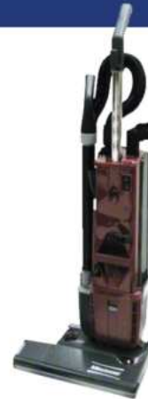
ASPIRADORA PHENOM 18