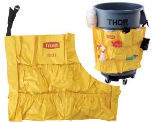
FUNDA DE ACCESORIOS