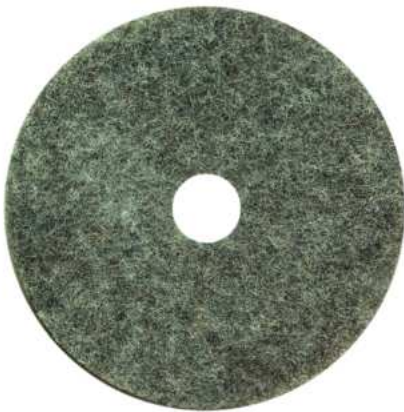
DISCO DE PULIR NATURAL