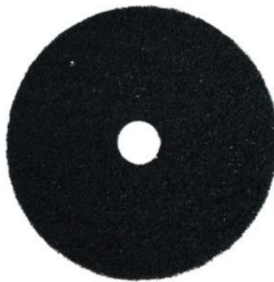
DISCO DE FREGAR INTENSO