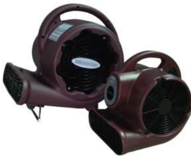
BLOWER DE ALFOMBRAS AS3M / AS3