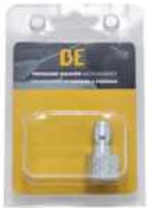
3/8" QC MNPT SS PKG

Longitud de la manguera: 50 pies Material: polímero híbrido Escribe: Baja presión