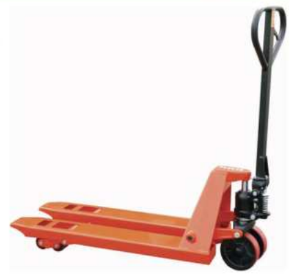
TRASPALETA 2500kg 550mm x 1150mm