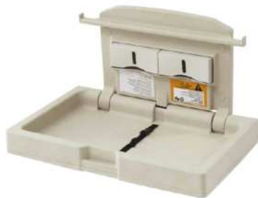
ESTACION DE CAMBIO PARA BEBES