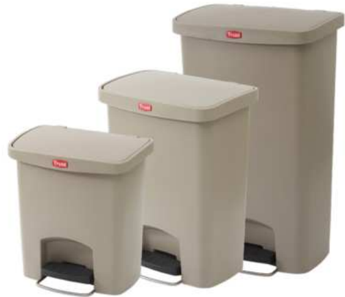
ZAFACON DE PEDAL 15/ 30/ 50 LTS