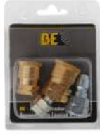
KITS DE ACOPLADOR Y ENCHUFE