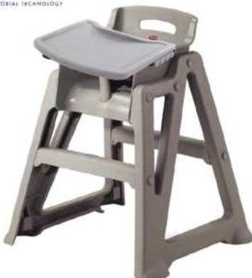
SILLA DE BEBE