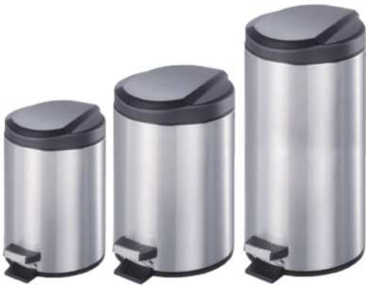
ZAFACON REDONDO DE PEDAL ACERO INOXIDABLE