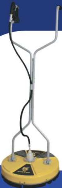
PULIDORA DE AGUA PARA SUPERFICIES PLANAS DE 20 PULGADAS