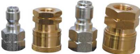
KIT DE ACOPLAMIENTO FNPT