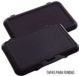
TAPAS PARA FUNDAS

Soporte para destornilladores, alicates y otras herramientas.