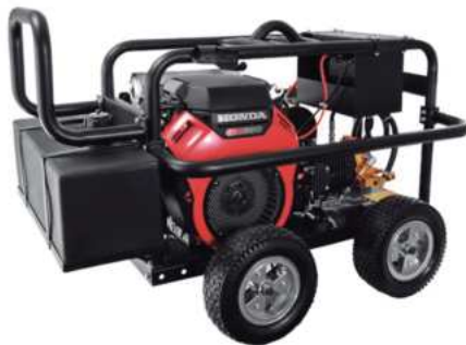
HIDROLAVADORA A GASOLINA PSI:5000