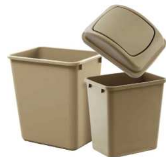
ZAFACON CON TAPA BASCULANTE DE 3.4 Y 6.8 GALONES