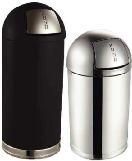
ZAFACON BASCULANTE DE ACERO 12 Y 15 GAL