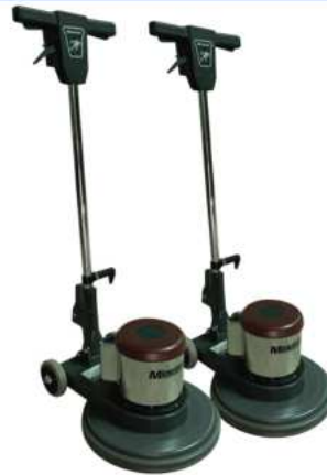
FREGADORAS DE PISO FR 17115-11 / 20115-11