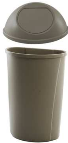
ZAFACON MANOS LIBRES 80 LTS