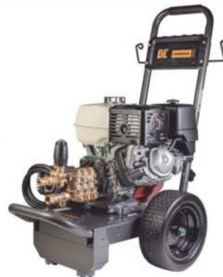
HIDROLAVADORA A GASOLINA PSI:2500