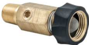
FILTRO 1/2" MNPT X 3/4" FGHT

kit de 4 boquillas de 0°, 15°, 40° y una boquilla para jabón. Entrada macho de quick-connector de 1/4-in. Para cambios rápidos de boquillas. Máximo flujo de 4,0 GPM.