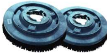
CEPILLO DE NYLON 17" & 20" CON ALIMENTACIÓN DE DUCHA