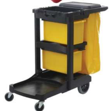
CUBOS Y GAVETAS