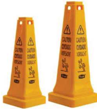
CONOS DE SEGURIDAD