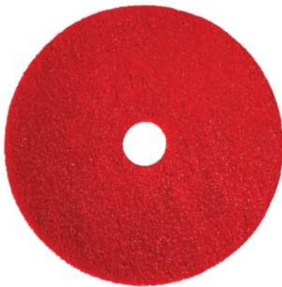
DISCO DE FREGAR LIGERO