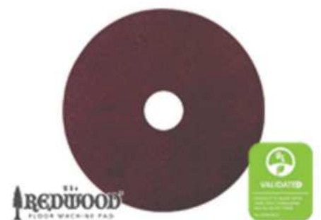
DISCO REDWOOD SUPER INTENSO