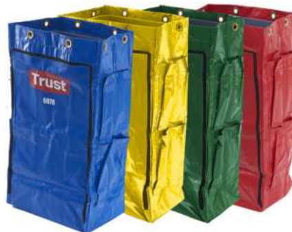
FUNDA PARA CARRO DE LIMPIEZA CON BOLSILLOS LATERALES