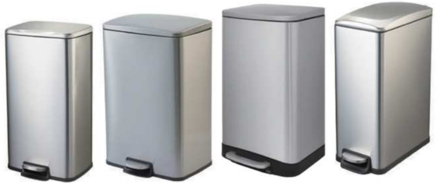
ZAFACON DE ACERO INOXIDABLE RECTANGULAR DE PEDAL