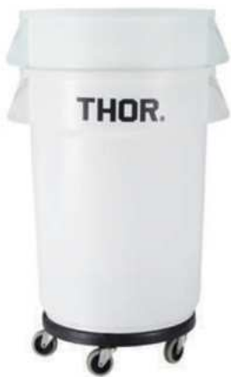
CONTENEDORES PARA LAVAR ALIMENTOS.