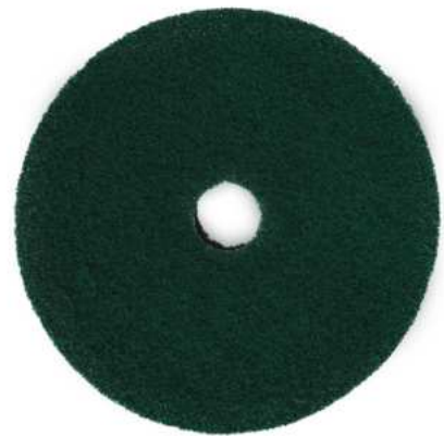
DISCO DE FREGAR INTERMEDIO