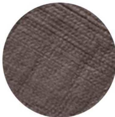
DISCO DE LANA DE ACERO